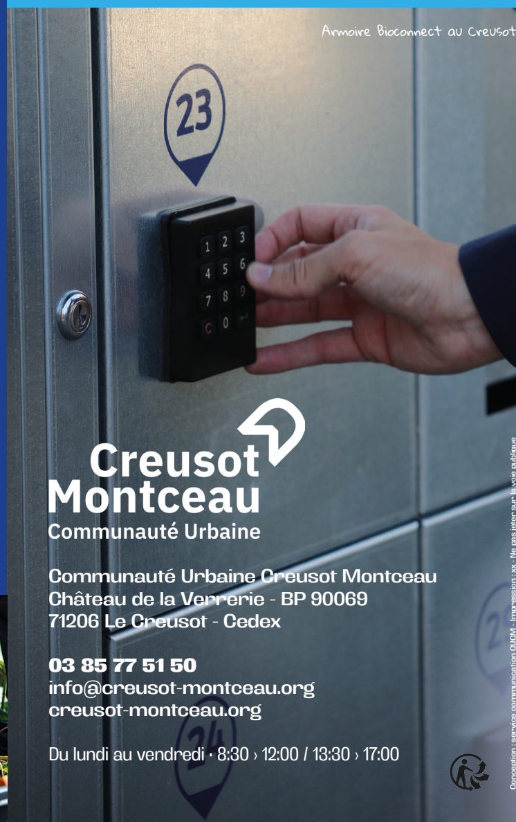
Armoire Bioconnect au Creusot