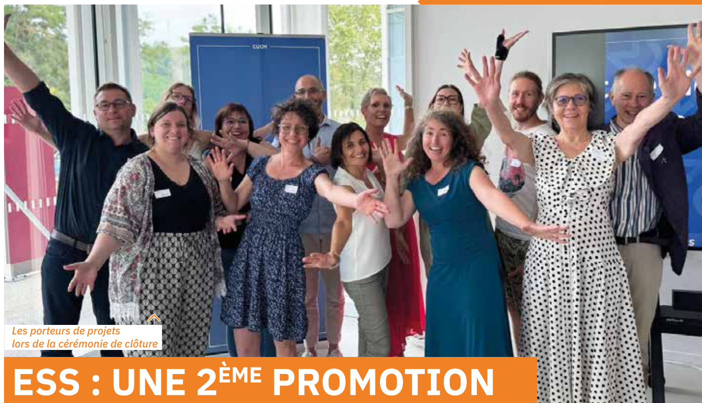
Les porteurs de projets lors de la cérémonie de clôture