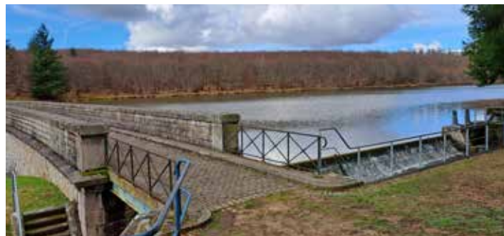
Le bassin d'eau brute (eau non traitée) du Martinet au Creusot.

offre également une meilleure attractivité aux candidats potentiels et un amortissement annuel des investissements moins important. Ceci, tout en garantissant aux abonnés une eau potable de qualité. L'appel à candidature sera lancée à l'automne 2024 pour un contrat qui s'étalera de janvier 2026 à décembre 2034.