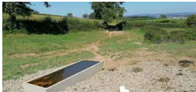
^ Construction d'un abreuvoir.

La Communauté Urbaine a mis en place plusieurs actions pour aider les agriculteurs à trouver des solutions techniques pour l'approvisionnement en eau de leurs exploitations.