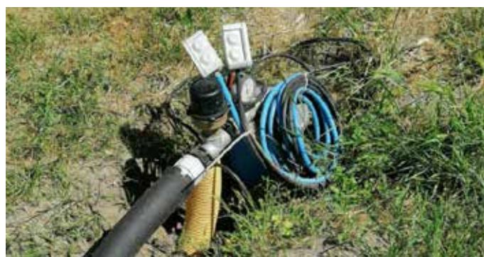
^ Raccordement électrique d'un forage.

Pour la Communauté Urbaine, cette opération menée en concertation avec les exploitants agricoles et les maires des communes permet de faire face aux épisodes de sécheresse de plus en plus fréquents, en mettant en place des solutions durables d'approvisionnement en eau, tout en gardant la maîtrise de la ressource.