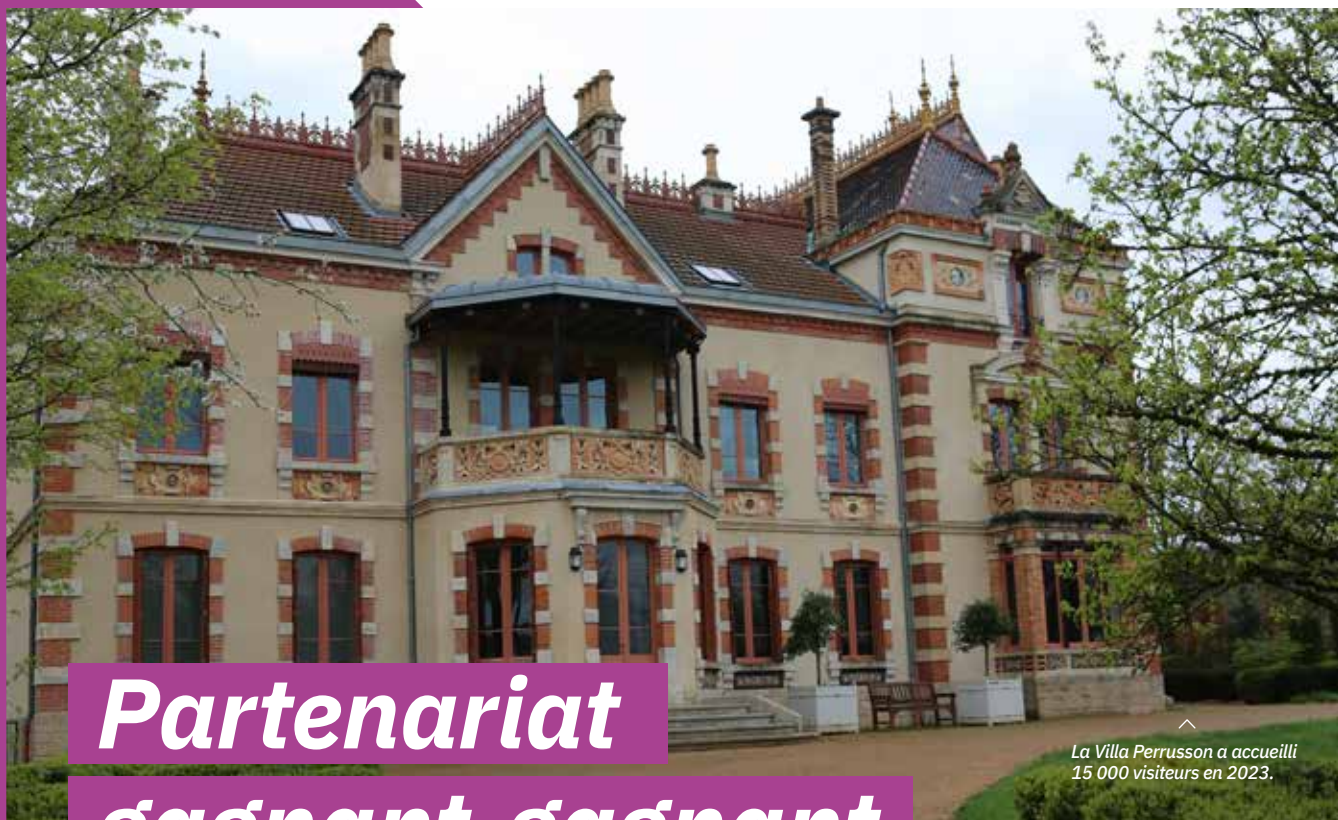
La Villa Perrusson a accueilli 15 000 visiteurs en 2023.